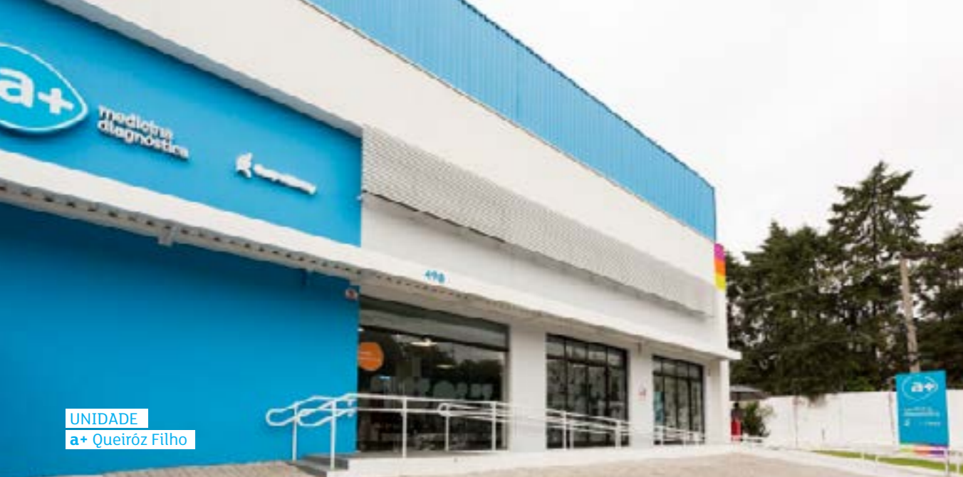
UNIDADE a+ Queiroz Filho