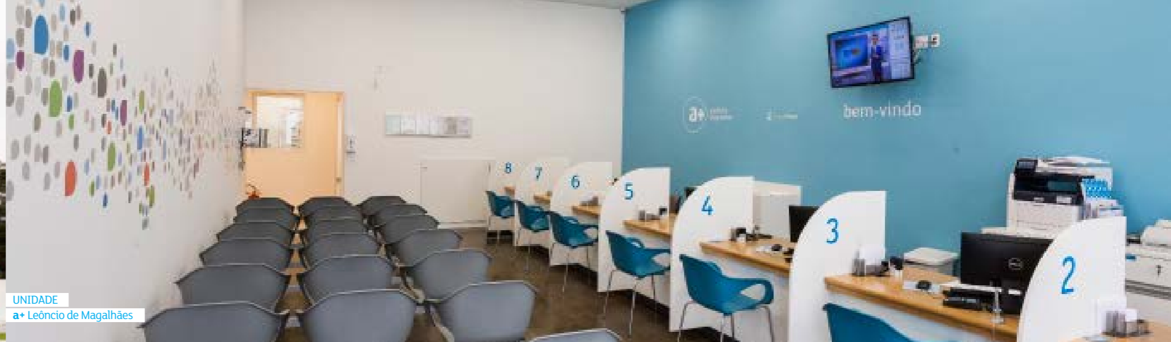
UNIDADE a+ Leôncio de Magalhães